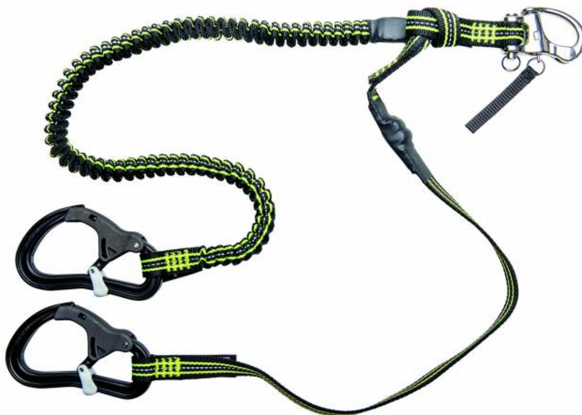
Proline - Wichard.

Les excellentes longes Wichard Proline, que nous avons testées dans le numéro 543 de Voiles et Voiliers (mai 2016), sont désormais disponibles en version largable «Proline'R». Côté harnais, un mousqueton type spi (en inox forgé) que l'on peut facilement larguer sous une charge modérée. De l'autre côté, un (ou deux) mousqueton(s) double sécurité ProSnap : lors de nos tests, l'ergonomie de cette pièce en aluminium développée par Wichard s'était avérée optimale. La gamme Proline'R comprend un modèle simple et un modèle double. Ces deux longes sont par ailleurs dotées d'un témoin de surcharge. Prix : 133 ou 210 €.